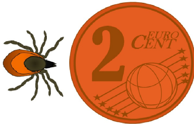
Figura 1. Ejemplo comparativo del tamaño del Ixodes ricinus frente a una moneda de 2 céntimos.